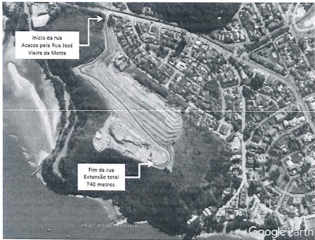
Vista aérea da rua a ser denominada