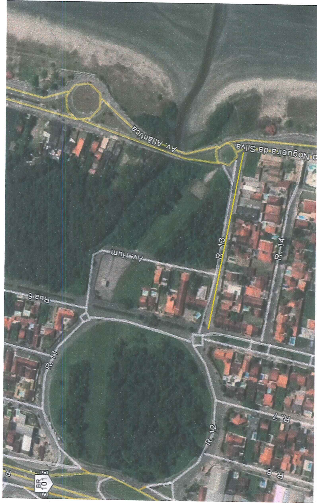
RUA TREZE - JARDIM BRITÂNIA EXECUÇÃO: JOANNE TORRALBO GIMENEZ LEMOS, MATRÍCULA 8312 FOTO: IMAGEM 2018