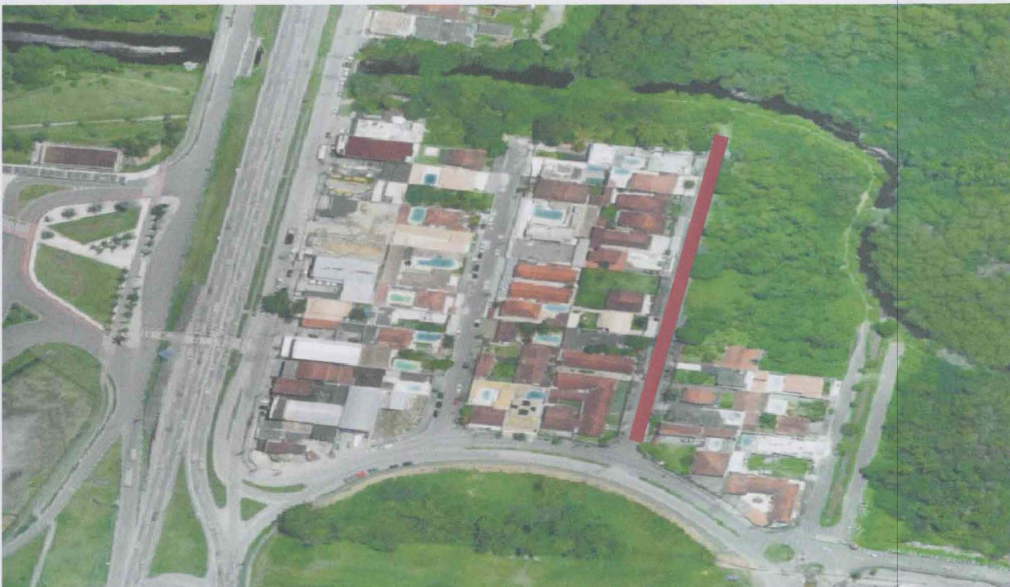
EXECUÇÃO: ARCÍLIO ALVES NETO – MATRÍCULA 22.495 FOTO: IMAGEM 2021